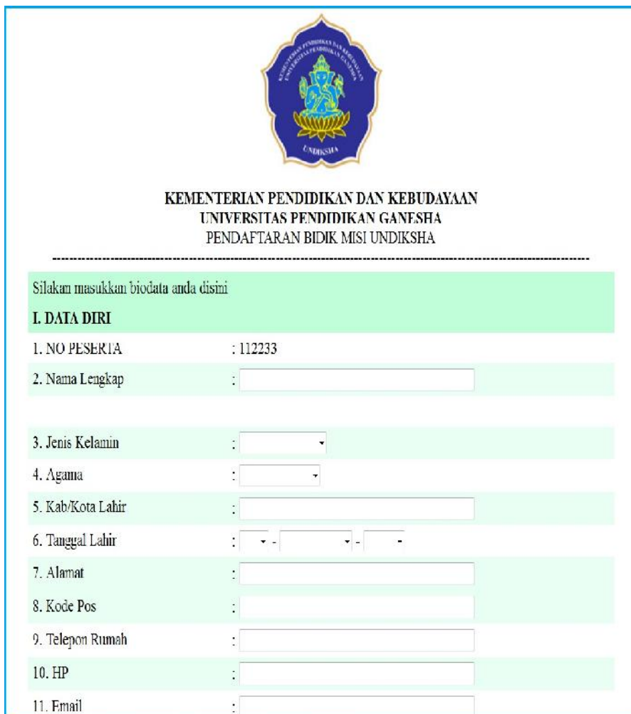
Gambar 2. Borang Data Diri

Setelah berhasil login kemudian dilanjutkan dengan mengisi Nama Lengkap (Sesuai Ijazah SMU/SMK), Jenis Kelamin, Agama, Kab/Kota Lahir, Tanggal Lahir, Alamat, Kode Pos, Telepon Rumah, HP dan Email.